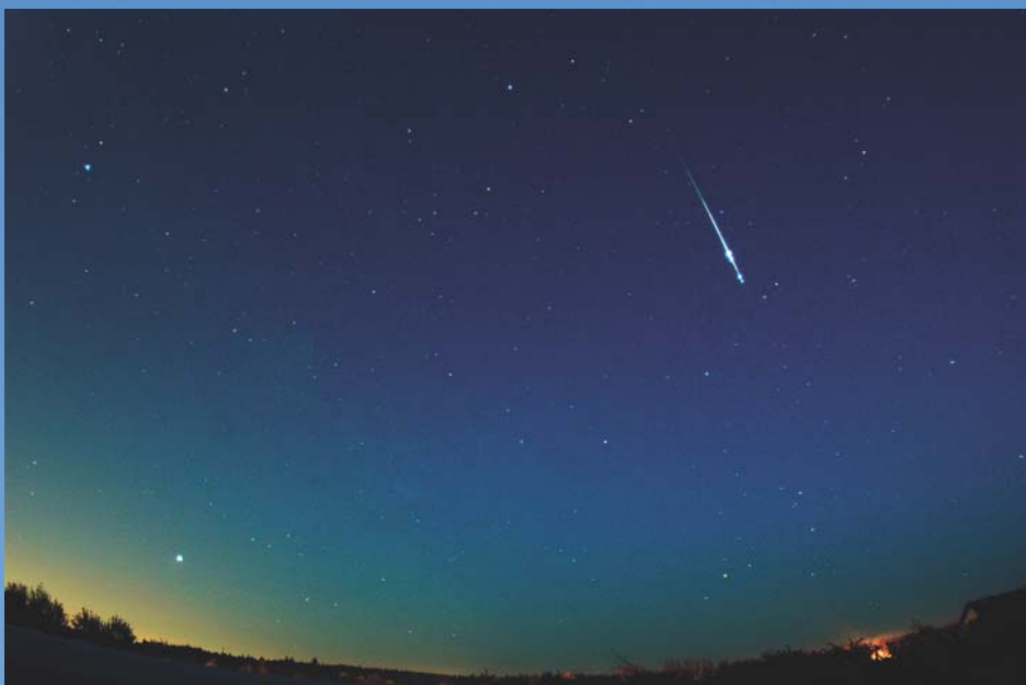
Bolid z 09.05.2008 r.

O d zarania dziejów ludzie wpatrujących się w rozgwieżdżone niebo zastanawiali, ciekawili, a czasami przerażali zjawiska takie, jak opisane powyżej. Meteory były często przedmiotem wierzeń, przesądów, mitów i folkloru, a znajdowane sporadycznie dziwne czarne kamienie uważano za święte, magiczne albo przeklęte. Trudno dziwić się starożytnym czy średniowiecznym, przeważnie niewykształconym ludziom, skoro nawet po licznie obserwowanym spadku meteorytu Weston w 1807 r., sam prezydent Stanów Zjednoczonych Thomas Jefferson powiedział: „Prędzej uwierzę, że dwóch jankeskich uczonych kłamie, niż że kamienie spadają z nieba”.